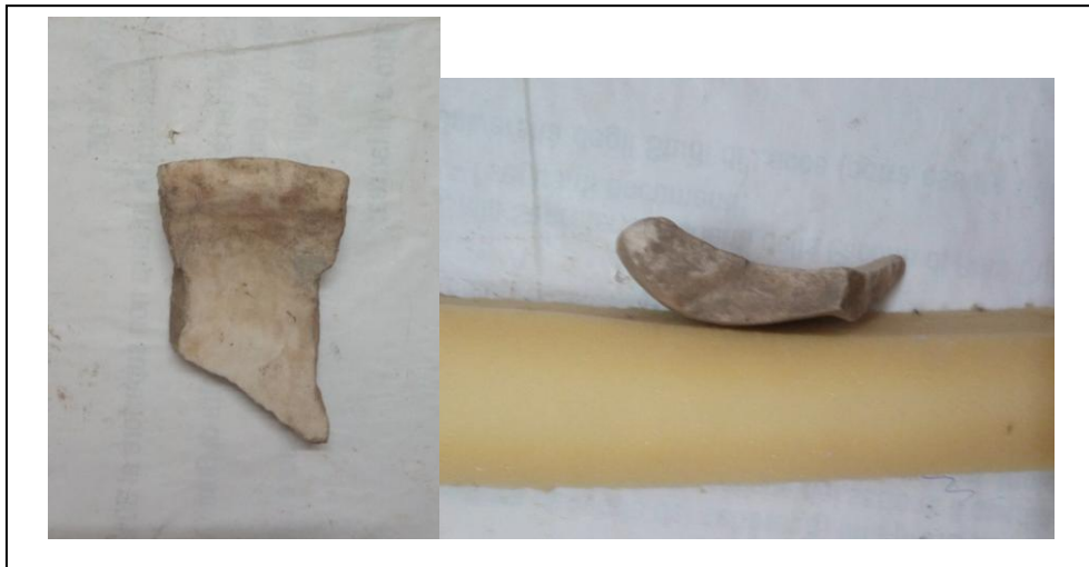
FRAMMENTI DI SIME FITTILI ARCAICHE 15 E 10 CM